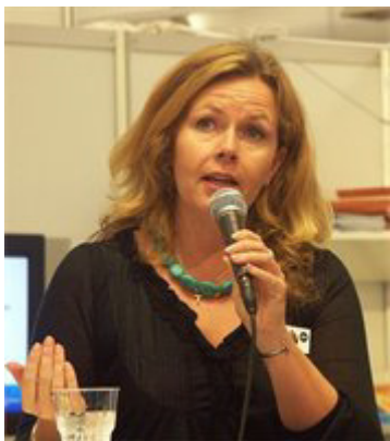
Cecilia Wikström, präst som förespråkar barnaoffer