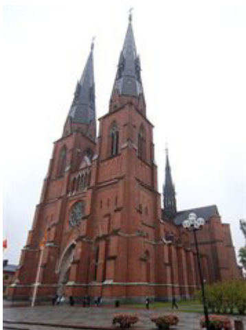
Uppsala domkyrka