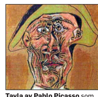
Tavla av Pablo Picasso som kan ha eldats upp i Rumänien. Foto: UNCREDTED

Målningarna uppges vara värda flera hundra miljoner kronor. (TT Spektra)