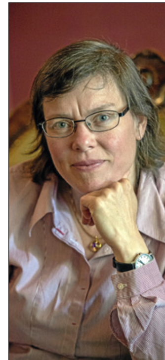
"Jag har ägnat väldigt mycket tid i mitt liv åt att fundera på varför det stod så där i ett sms, varför det inte kom och när jag ska skicka mitt nästa", säger författaren Lena Andersson.

"STYRKA VÄCKER BEUNDRAN men inte kärlek. Det brustna hos människan är det som inger kärlek. Men det brustna räcker inte. Det måste kompletteras med autonomi och självdistans. Sprickor skapar ömhet men förr eller senare alstras aggressioner av det som väcker ömhet. (...) Ester fick inga svar oavsett om hon gjorde sig stark, svag eller full av sprickor. Inte på hela veckan kom det något livstecken från honom."