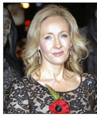
JK Rowling.

Efter avslöjandet har "The cuckoo's calling", som tidigare sålt blygsamt, gått som en raket på topplistorerna.