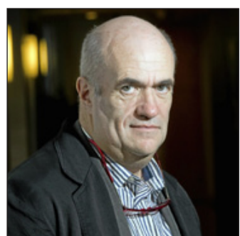
Colm Toibin.

Den 10 september presenteras en nedkortad nomineringslista och den 15 oktober tillkännages årets vinnare. (TT Spektra)